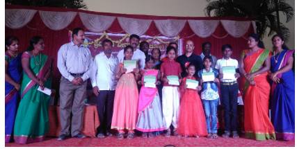
ಮುಖ್ಯ ಅತಿಥಿಗಳೊಂದಿಗೆ ಪ್ರಶಸ್ತಿ ವಿಜೇತ ವಿದ್ಯಾರ್ಥಿಗಳು